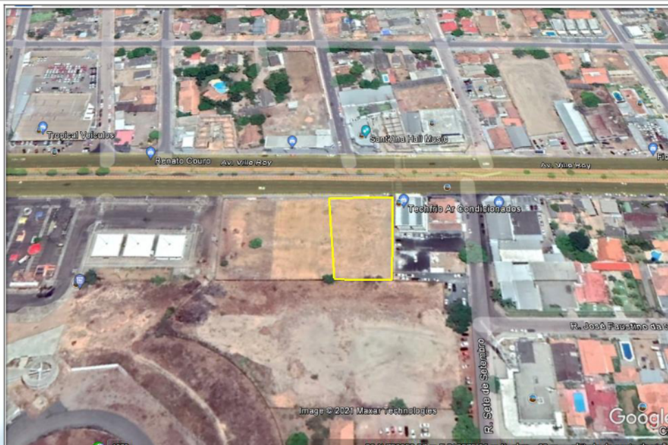
Figura 01- visualização da localização do empreendimento, na Av. Ville Roy

A área onde está localizado o empreendimento está inserida em área urbana (eixo comercial) da cidade de Boa Vista, onde a maior parte das habitações são constituídas de comércios, escritórios, mercados, residências, e etc, conforme mostra as figuras abaixo.