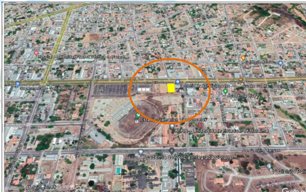
Figura 06: Polígono vermelho demonstra a Área de Influência Direta no raio de 200 metros a partir das divisas do empreendimento. Polígono vermelho é a localização do empreendimento

O diagnóstico da área de influência direta será dado maior ênfase sobre a vegetação e tipo de solo. Entretanto não será descartado a caracterização do recurso hídrico mais importante da área e o mais próximo do empreendimento.