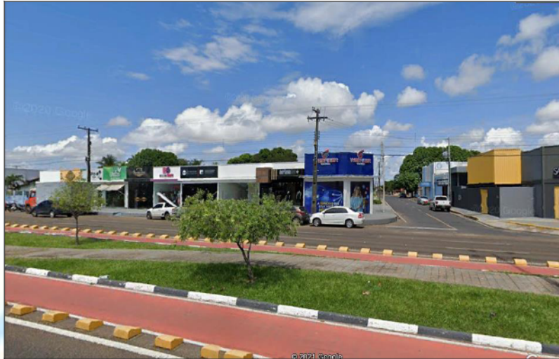
Figura 02 – Visualização da vizinhança (Frente) do empreendimento.