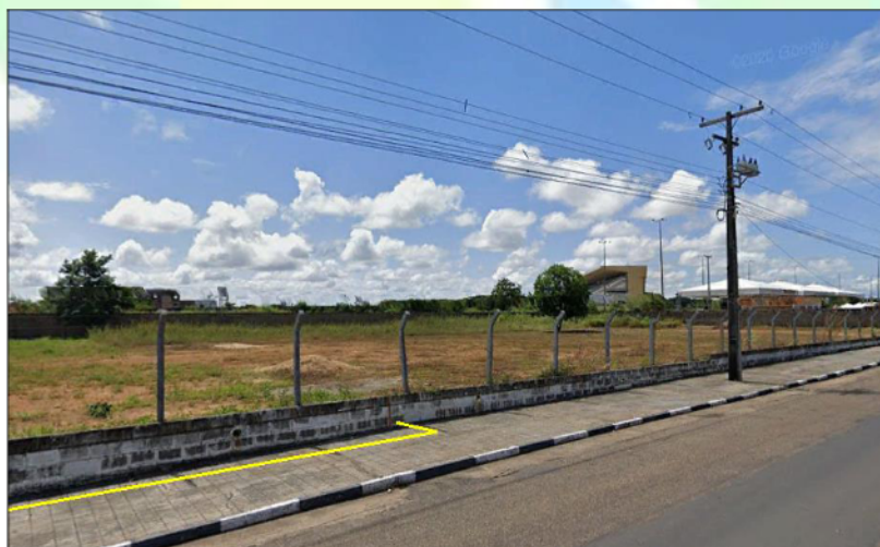
Figura 04: Visualização da vizinhança (lado direito) do empreendimento