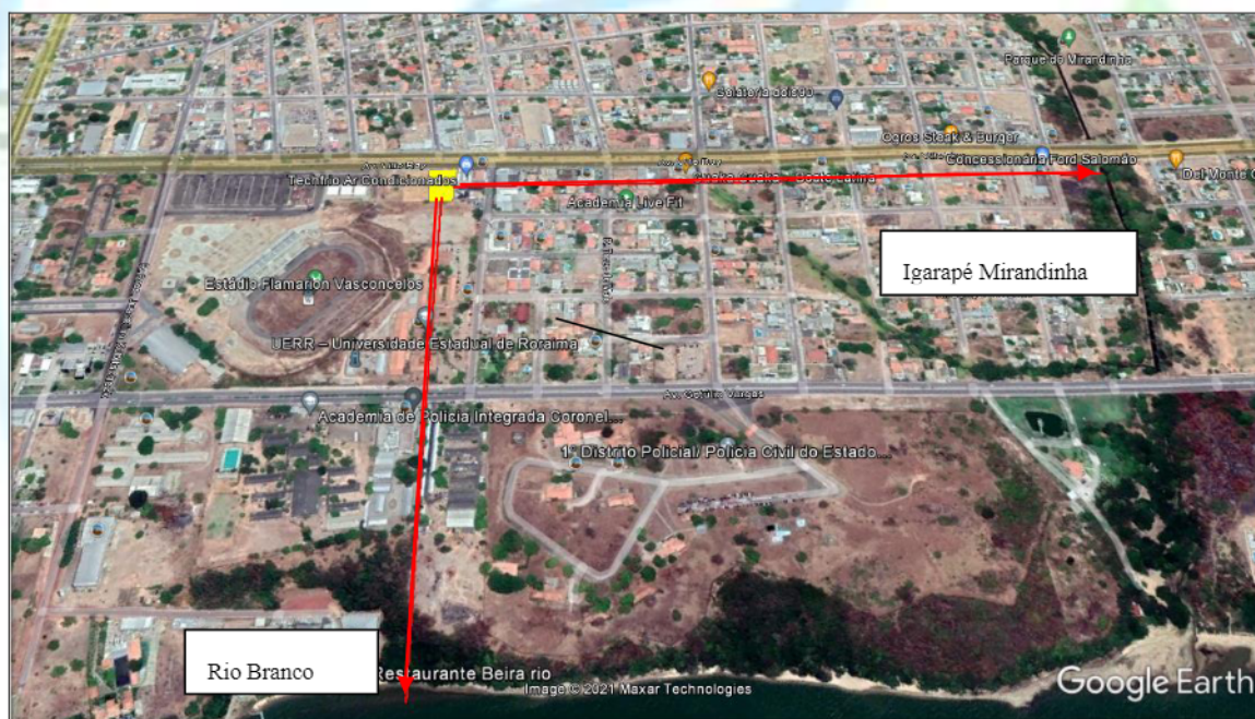
Figura 6: Imagem da localização do empreendimento com relação aos recursos hídricos mais próximos

Na área de Influência direta, não existe nenhum Recurso Hídrico, os Recursos hídricos mais próximo ao empreendimento está a aproximadamente 750 e 1.000 metros de distância.