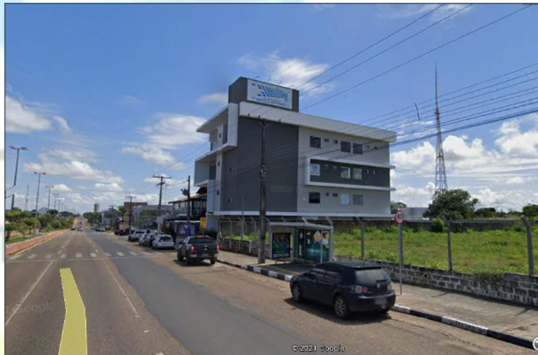
Figura 03: Visualização da vizinhança (lado esquerdo) do empreendimento