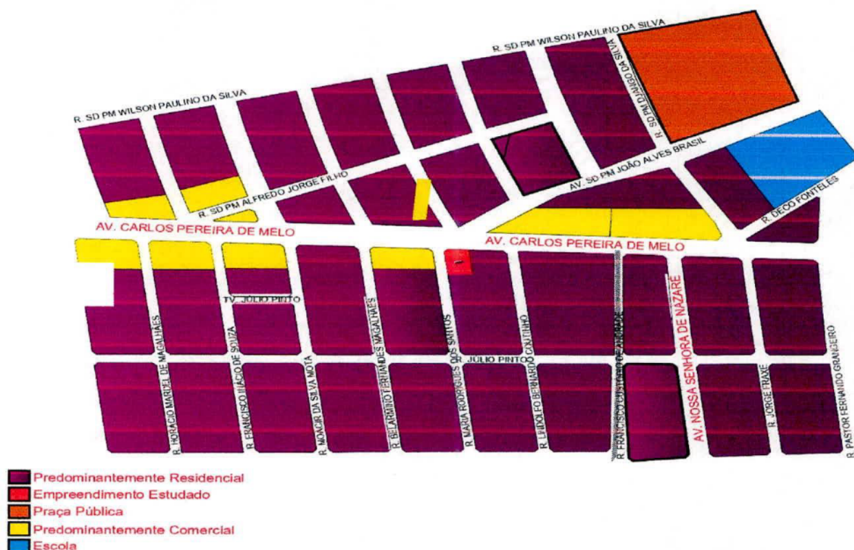
Figura 5: Identificação do entorno

O local onde o terreno da obra é localizado, possui diversos prédios comerciais/institucionais, o que agrega ao intuito comercial do empreendimento. A vizinhança residencial não será afetada pois a Av. Carlos Pereira de Melo já possui forte presença comercial.