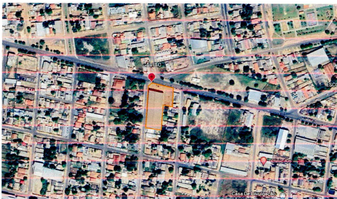
Figura 1: Localização do empreendimento

COORDENADAS GEOGRÁFICAS: LAT 2,8336536° LONG -60,7227106°