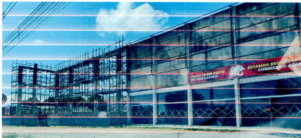
Figura 2: Terreno do empreendimento