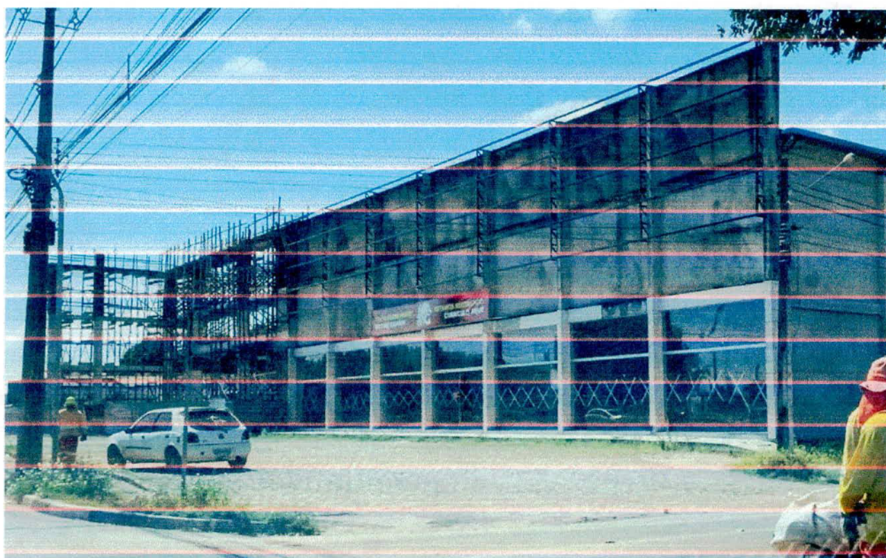
Figura 3: Terreno do empreendimento